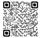
(佐賀県職員採用サイト)

※ 時間に余裕を持ってお申し込みください。 なお、予期せぬ機器停止や通信障害などによるシステムトラブルの責任は一切負いません。 ※ 試験日程等は変更となることがありますので予めご了承ください。 最新の情報は、佐賀県職員採用サイト( https://saga-saiyou.net )でお知らせします。